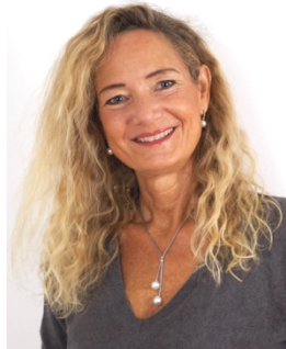
Senior Level RT Trainer Supervisorin

Einführung in die RT: Zum Kennenlernen der Methode besteht die Möglichkeit, nur das Foundation Training (Ausbildungstag 1+2 der klinischen Qualifikation) zu buchen.